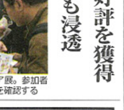
展示会でも大好評を獲得

「ガチャポンで爽快」は、分タイプなどが発売されたが、その手軽さが大好評。出荷増を加速していき、バージョンになっていった。