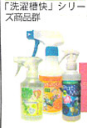
「洗濯槽快」シリーズ商品群

ホタテ貝の貝殻から生まれた「洗濯槽快」はSOKAIKUNシリーズとして多様な商品群で発売され、ついに販売累計1000万個を達成した。業務用では石油系ドラッグ剤「スッキリ爽快」、シミ汚れやエリ・ソデ汚れに効く「スッキリ爽快」などが市場を揺るがしている。「洗濯槽快」は初年度は5万個だったものが、次第に年平均90万個出荷へ