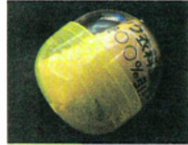
洗濯槽快分タイプとサービス券が入ったカプセル

分タイプは「スッキリ爽快」分タイプなどが発売されたが、その手軽さが大好評。出荷増を加速していき、バージョンになっていった。