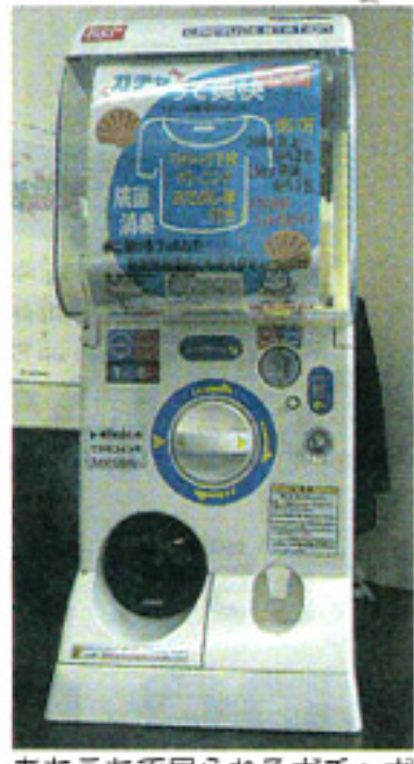
あちこちで見られるガチャポンマシン

界向けには「スッキリ爽快」分タイプ、家庭用「ドラム式洗濯槽快」には「ドラム式洗濯槽快」分タイプなどが発売されたが、その手軽さが大好評。出荷増を加速していき、バージョンになっていった。