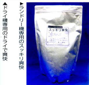
▲ランドリー機専用のスッキリ爽快 ▲ランドリー機専用のドライで爽快